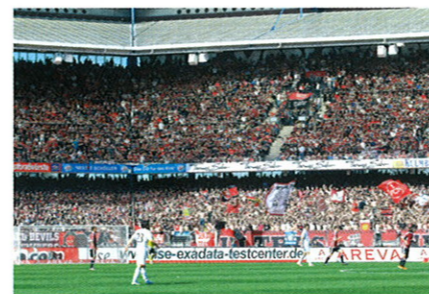
Abbildung 2: Exadata-Promotion beim 1. FC Nürnberg

weiterhin zurückgreifen. Dies ist möglich, da die Exadata aus den aktuellsten Standard-Hardware-Komponenten (u.a. X86, SAS, SATA, PCIe Flash-Cards, Infiniband) kombiniert mit dem Betriebssystem Oracle Enterprise Linux und den klassischen Oracle Datenbank Features wie ASM, RAC, FRA, RMAN und Data Guard sowie der altbekanntesten Administrationsoberfläche Enterprise Manager / Grid Control gebaut wurde.